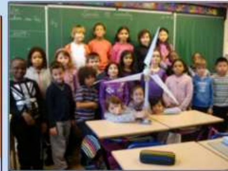
Réalisation d'une éolienne