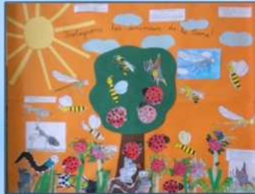
Création d'un ECO Code