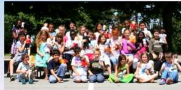
Réalisation poupées Frimousse UNICEF