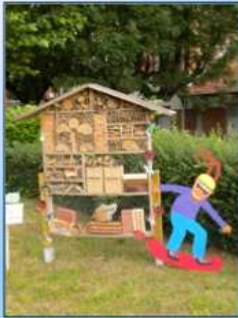
Hôtel à insectes