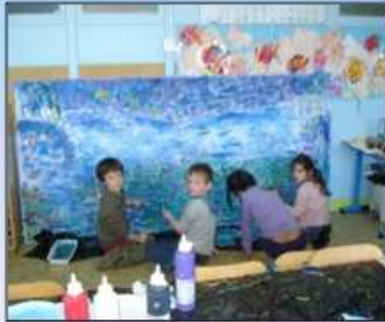
Fresque sur l'eau