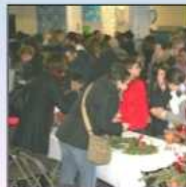
Marché des Solidarités