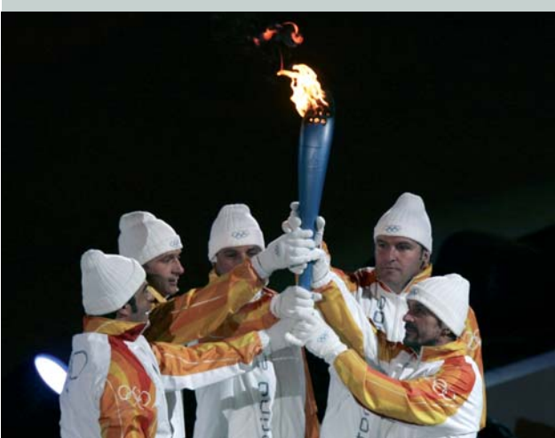
En 2006, lors de la cérémonie d'ouverture des Jeux Olympiques de Turin (ITA), cinq porteurs entrent dans le stade avec la torche. Cette image représente la paix, l'esprit d'équipe et le respect d'autrui qui règnent aussi au cours des épreuves des Jeux.

Illustration : HANRY DODIV par ALAIN © Galerie Edition