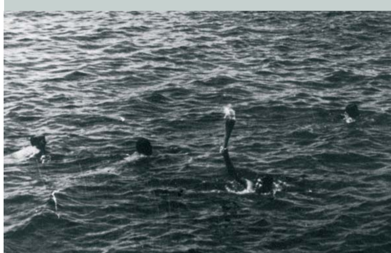
Dans l'eau, un nageur assure un relais de la flamme olympique des Jeux Olympiques de Mexico 1968 (MEX).

Illustration: THIERRY DUBOY par Buache © Comité National