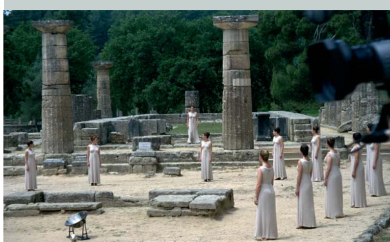
Les prêtresses dans le temple d'Héra.

Illustration: F. HANRY / DDBP par Alain & Grégoire Gellens