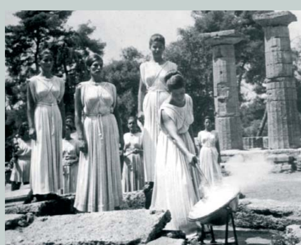
Les vestales captent les rayons du soleil pour allumer la flamme olympique.