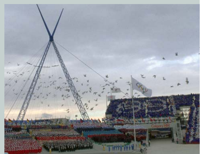
Cérémonie d'ouverture des Jeux Olympiques de Calgary 1988 (CAN). Deux autres symboles olympiques : le drapeau et la colombe.

Connaissez-vous les anneaux, la devise et la flamme olympique ?