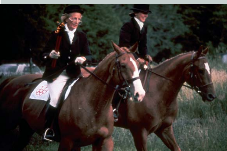
Un relais de la flamme olympique des Jeux Olympiques de Montréal 1976 (CAN) effectué à cheval.

Illustration: P. BUCHACHE pour le Musée Olympique