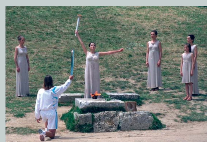
Le premier porteur de la flamme des Jeux Olympiques de Sydney 2000 (AUS).

Quelques mois avant l'ouverture des JO, la flamme est allumée à Olympie (Grèce) devant les ruines du temple d'Héra, à proximité du stade où se déroulaient les Jeux Olympiques de l'Antiquité. Elle est ensuite acheminée par relais jusque dans la ville organisatrice des Jeux, quelque part dans le monde.