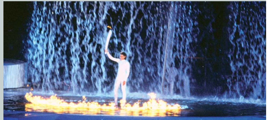
Dernière relayeuse, l'australienne Cathy Freeman, d'origine aborigène allume la vasque du stade olympique lors de la cérémonie d'ouverture des Jeux Olympiques de Sydney 2000 (AUS).