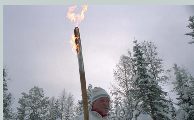
La torche des Jeux Olympiques d'hiver de Lillehammer 1994 (NOR) est deux fois plus grande qu'habituellement.