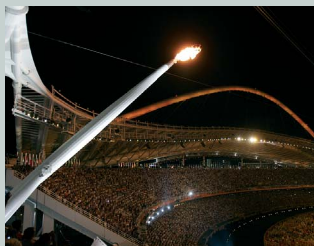
La flamme olympique brûlera dans la vasque du stade olympique pendant toute la durée des Jeux. Ici, il s'agit de la vasque des Jeux Olympiques d'Athènes 2004 (GRE).