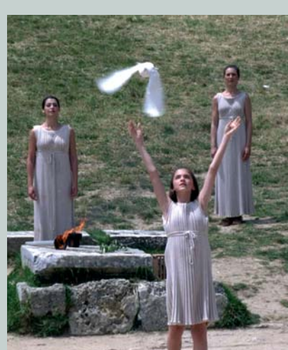
Lâcher de colombe lors de la cérémonie d'allumage de la flamme à Olympie.