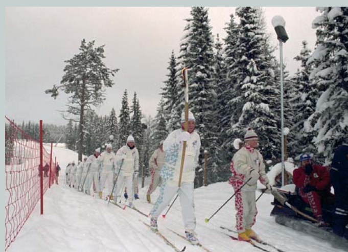
Le relais de la flamme olympique des Jeux Olympiques d'hiver de Lillehammer 1994 (NOR) s'est aussi déroulé en ski de fond.