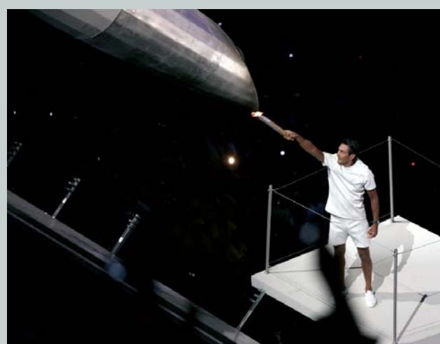
Lors de la cérémonie d'ouverture des Jeux Olympiques d'Athènes 2004 (GRE), Nikolaos Kaklamanakis, le dernier porteur de la flamme olympique allume la vasque du stade olympique.