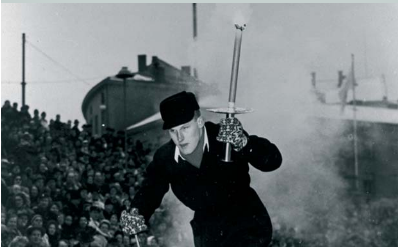
Un relayeur de la flamme des Jeux Olympiques d'hiver d'Oslo 1952 (NOR). A l'occasion de ces Jeux la flamme n'a pas été allumée à Olympie mais à Morgedal, dans le foyer de Sondre Norheim, pionnier du ski moderne.