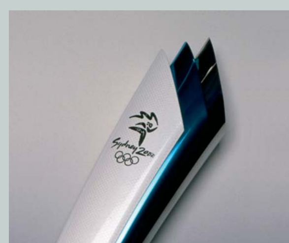
La torche des Jeux Olympiques d'été de Sydney 2000 (AUS).