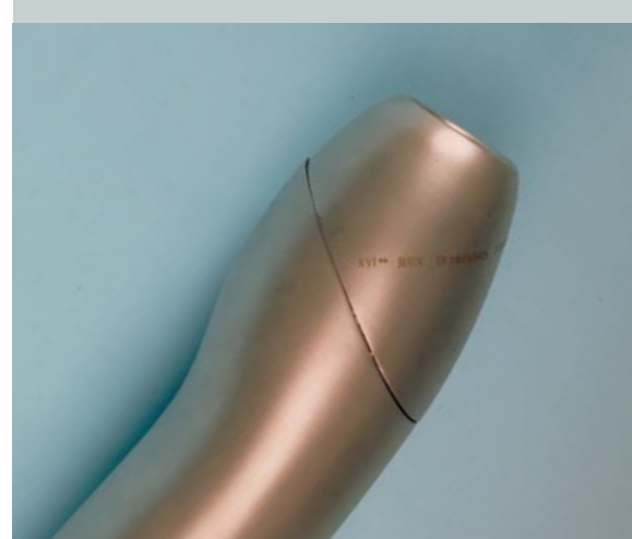
La torche des Jeux Olympiques d'hiver d'Albertville 1992 (FRA).