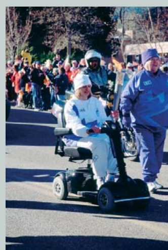
Des relayeurs handicapés ont également la chance de pouvoir porter la torche.