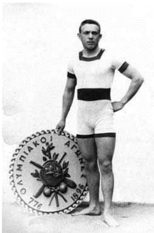
Alfréd Hajós (01/02/1878 – 12/11/1955)

Aux premiers Jeux Olympiques Modernes (1896, Athènes), Alfréd Hajós, étudiant en architecture hongrois, âgé de 18 ans, remporta deux médailles d'or :